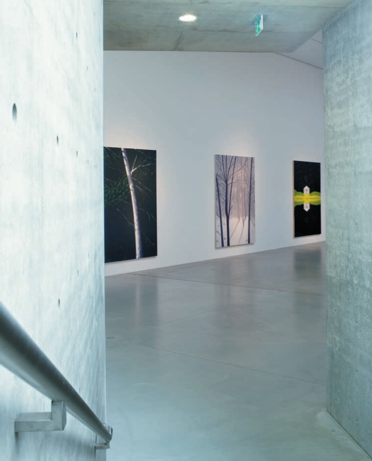
Blickachsen: Ando entwarf den Bau für die Langen Foundation 2001. Vier Jahre zuvor entstand „Grey Coat“ von Alex Katz.