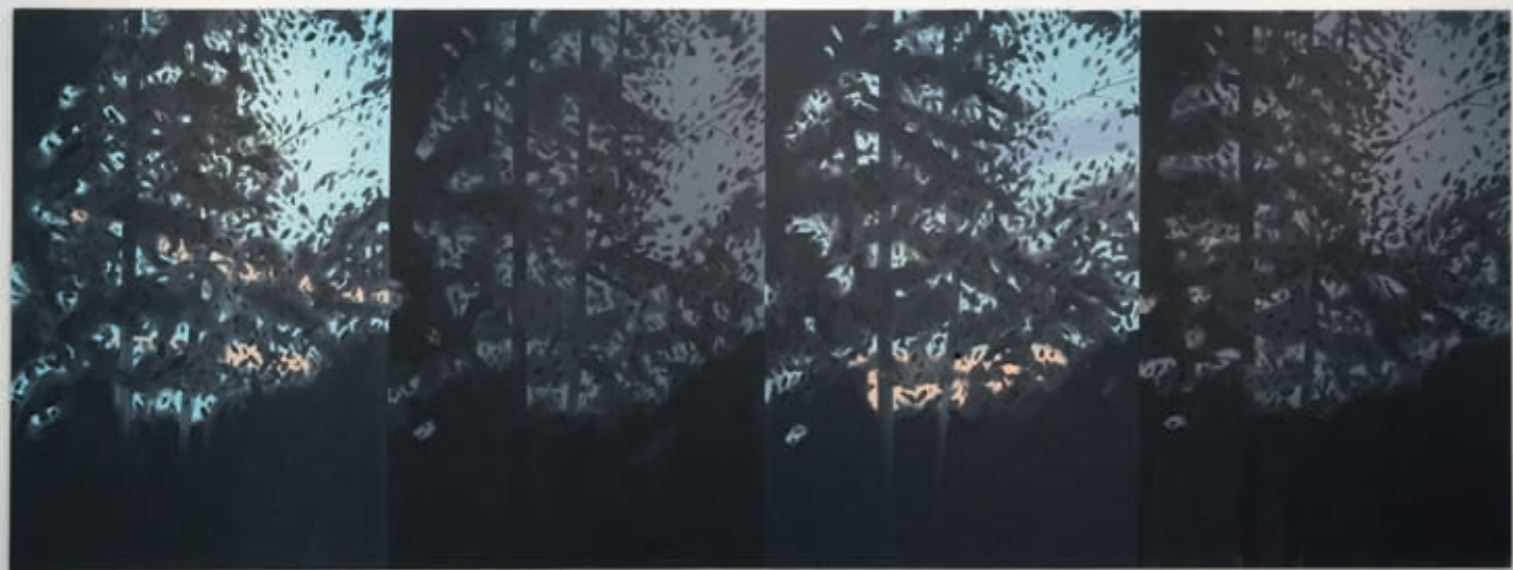
Inspirationsquelle ist für Alex Katz die japanische Kunst mit ihren Holzschnitten. Etwa bei „My Mother's Dream“ von 1998. Perfekter Rahmen dazu: die ruhige Betonarchitektur von Tadao Ando in Neuss.