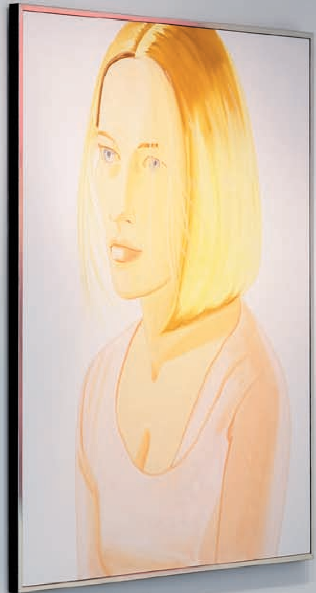
Monochrome Bildhintergründe, die aus seiner Zeit als Theaterdesigner stammen: Alex Katz schnitt Figuren aus, um sie in die Kulissen zu setzen. Links: „New Pink“ von 2004, rechts: „Mae“ von 2003.