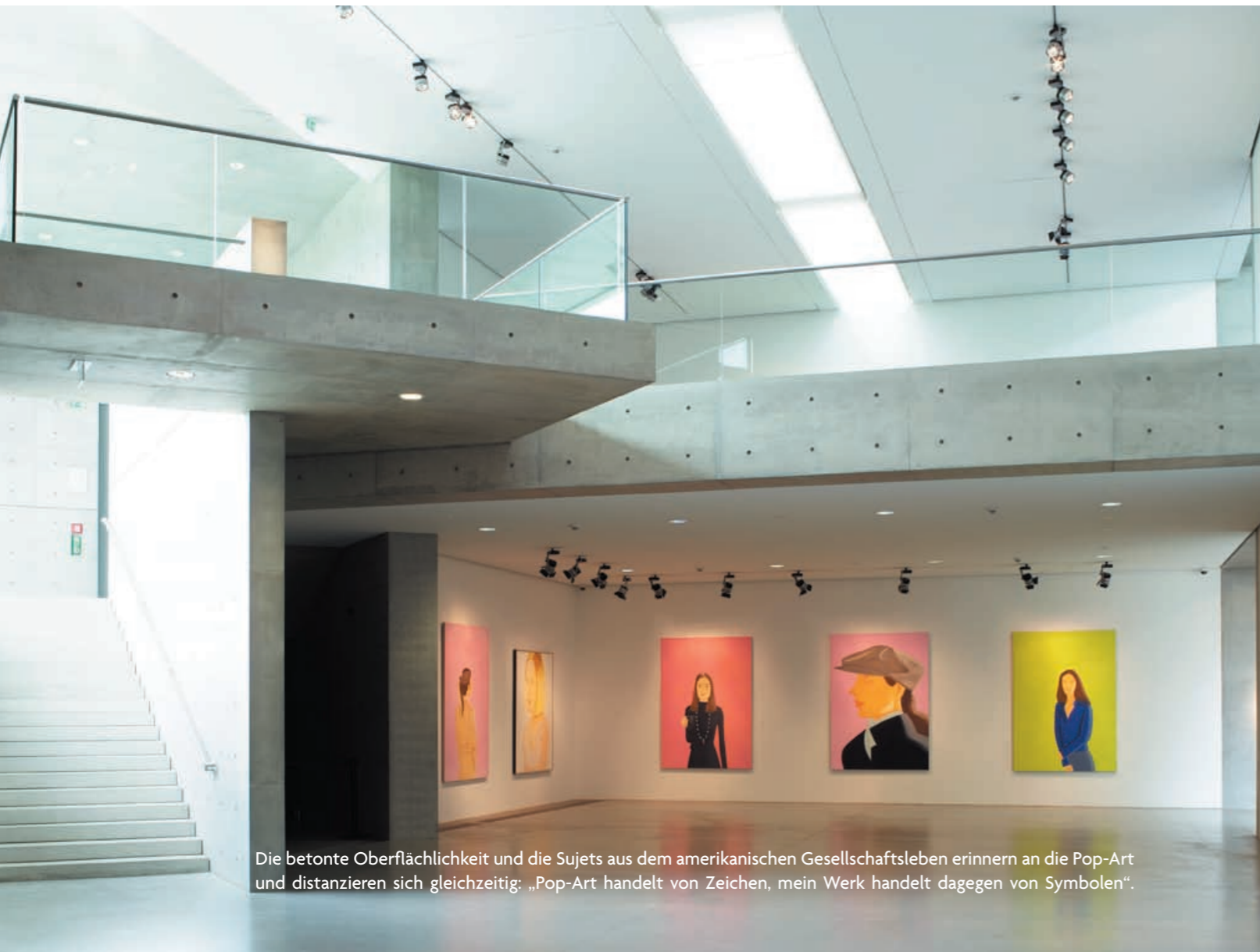
Die betonte Oberflächlichkeit und die Sujets aus dem amerikanischen Gesellschaftsleben erinnern an die Pop-Art und distanzieren sich gleichzeitig: „Pop-Art handelt von Zeichen, mein Werk handelt dagegen von Symbolen“.